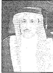
محافظ رأس ثنورة فيحان بن قويد

ولسكن خادم الحرمين الشريفين - أیده الله - وبما يملكه من صفات القائد المحمك القائد الذي استشعر عظم الأمانة الملقاة على عاتقه فسطر بأفعاله في تاريخ هذه الولاية الغنية صفحات من نور بزيارته الثقافية التي يهدف من خلالها للقاء أبناء المواطنين عن قرب