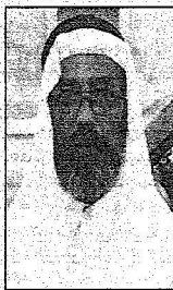
لواءن علي عطية القاسمي