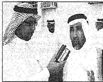
الشيخ عثمان القرني يتحدث للزميل السعودي