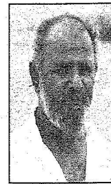
لواءن جهمان جمع جمعان