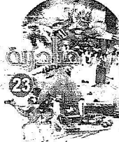
« الجزيرة » - عوض مانع القحطاني - محمد السيد - سعود الحذلي

شرف خادم الحرمين الشريفين الملك عبد الله بن عبد العزيز آل سعود - حفظه الله - وأخوه جلالة ملك مملكة البحرين الملك حمد بن عيسى آل خليفة، ويحضر صاحب السمو الملكي الأمير سلطان بن عبد العزيز ولي العهد نائب رئيس مجلس الوزراء وزير الدفاع والطيران والمفتش العام الحفل الخطابي والسخي الكبير ضمن فعاليات المهرجان الوطني للتراث والثقافة في دورته الثالثة والششرين الذي ينظمه الحرس الوطني سنوياً بالجنادرية.