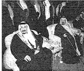
الأميران بندر ومتعب يتابعان الحفل