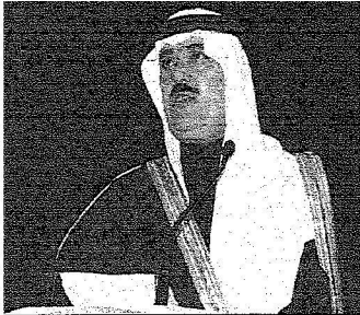
الأمير متعب بن عبد الله يلقي كلمة