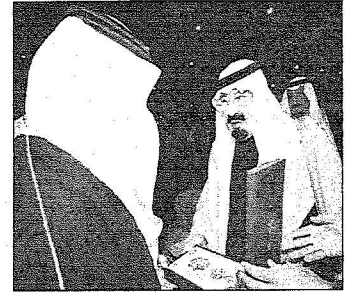
الملك يسلم وشاح الملك عبد العزيز تكريماً للفقيد التريجوري لئجله عبد الحسن