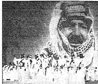
جانب من أوبريت عهد الخير