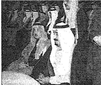
الأميران سلمان وسلام يتابعان الحفل الخطابي والفني