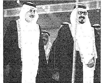
ولي العهد والأمير نايف يحييان أبناءهم المواطنين خلال الحفل الخطابي