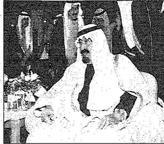
خادم الحرمين وملك البحرين وأصحاب السمو الملكي الأمراء يتابعون الحفل الخطابي والفتي