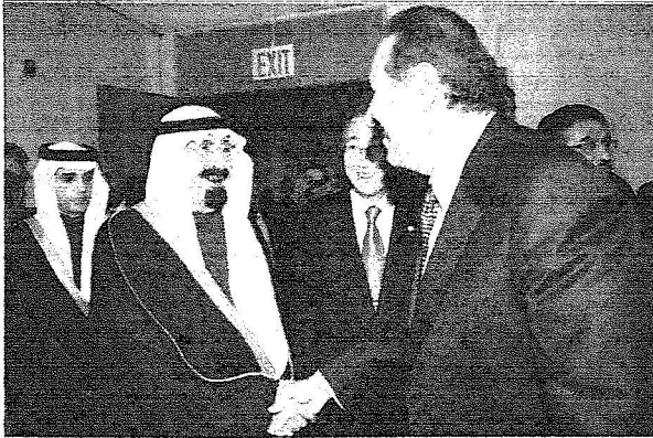
الملك عبدالله يصافح وزير خارجية قطر

أقام الأمين العام للأمم المتحدة بان كي مون في مقر المنظمة بنيويورك مساء أمس الأول مأدبة عشاء تكريماً لخادم الحرمين الشريفين الملك عبدالله بن عبدالعزيز آل سعود وأصحاب الجلالة والفخامة والسمو والدولة قادة وزعماء وممثلي الحكومات لمختلف دول العالم الذين سيشاركون في الاجتماع عالي المستوى للحوار بين الأديان والثقافات والحضارات الذي يعقد بمقر الأمم المتحدة في نيويورك استجابة لدعوة خادم الحرمين الشريفين .