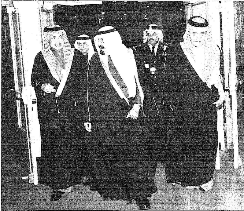
الملك أثناء وصوله الى مقر الأمم المتحدة