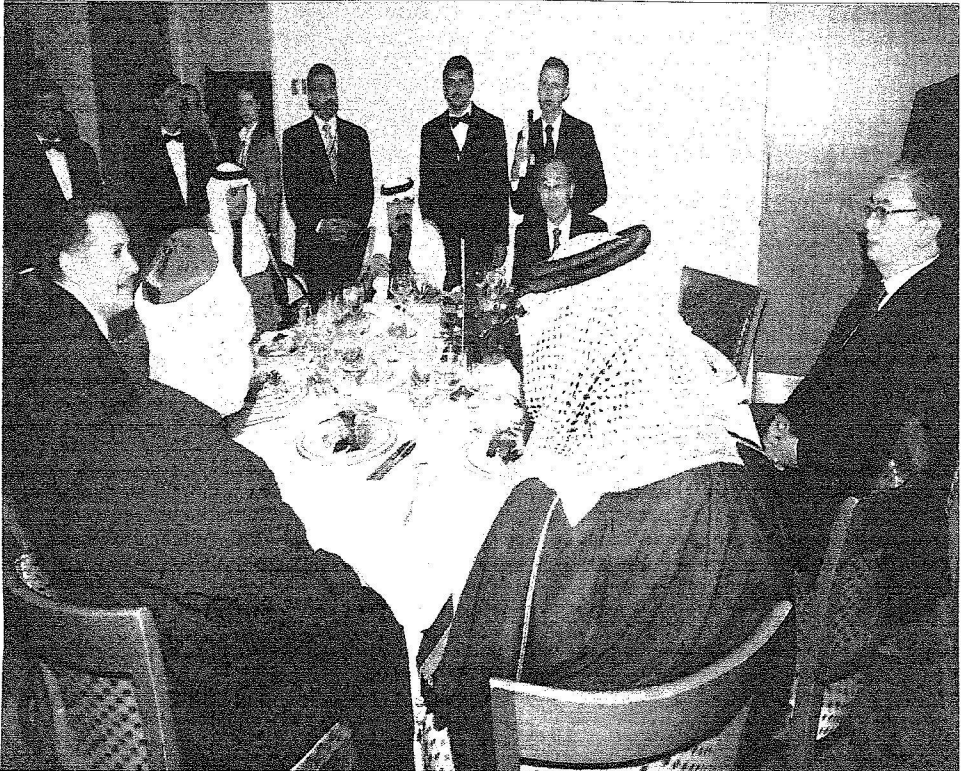
خدام الحرمين يتناول العشاء مع بان كي مون والمشاركين في الحوار