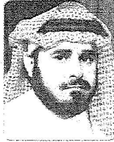
الملك فيصل بن عبدالعزيز بن محمد آل سعود

«إن نكزى اليوم الوطنى نكزى مجيد لكل أبناء شعبنا وتذكرنا بالعطاءات والملاحم البطولة التى سطرها الأجداد بقيادة القائد المحنك ومؤسس ونوحى الجزيرة العربية الملك عبدالعزيز طيب الله ثراه بعد أن وحد الشتات والتفرقة على كتاب الله وسنة نبيه صلى الله عليه