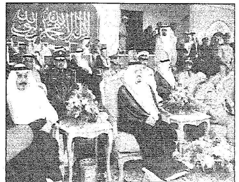
الأمير فيصل بن خالد راعياً للحل