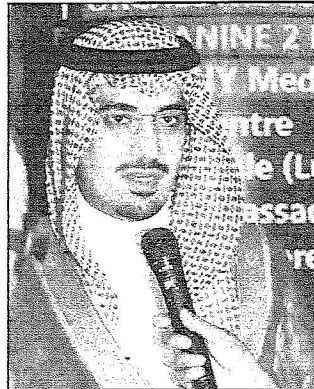
الأمير نواف بن فيصل

بعد ذلك تبدأ اللجنة الوزارية اجتماعاتها برئاسة صاحب السمو الملكي الأمير نواف بن فيصل بن فهد بن عبدالعزيز نائب الرئيس العام لرعاية الشباب رئيس اللجنة حيث سيلقي سموه كلمة افتتاحية لأعمال اللجنة يعقب ذلك تقرير لاسانسة المؤتمر