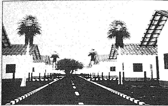
أحد الشوارع المزمدة في المدينة

دولاراً ومليعياً رياضياً يقام على مساحة ٢م١٠٧٨ بتكلفة «٢٣٦١٣١» دولاراً. وفي الختام رفع الدكتور الحارثي شكره وتقديره للقيادة الرشيدة وعلى رأسهم خادماً الحرمين الشريفين وسمو ولي عهده الأمين وسمو وزير الداخلية على ما تقدمه حكومة المملكة من أعمال خيرة للتحضيرين في شتى بقاع الأرض سائلاً الله عن وجل أن يحفظ هذه البلاد من كل سوء تحت قيادتها الرشيدة.