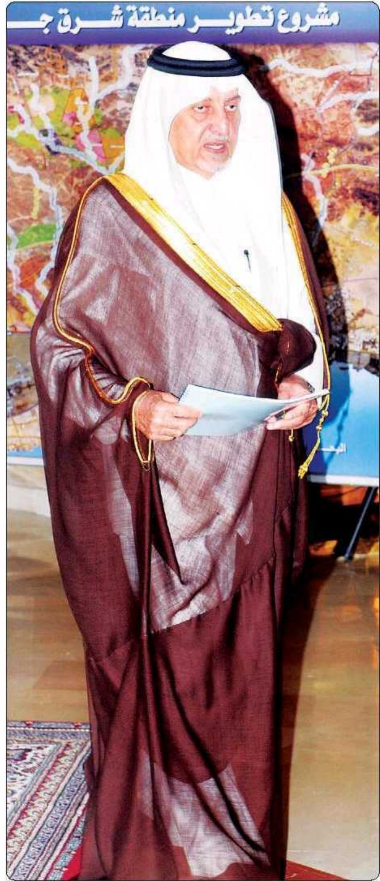
الأمير خالد الفيصل