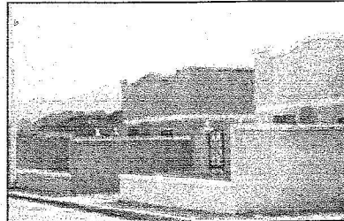
جانب من الوحدات السكنية

برعاية كريمة من خادم الحرمين الشريفين الملك عبد الله بن عبدالعزيز رئيس مؤسسة الملك عبد الله بن عبدالعزيز لوالديه للإسكان التنموي - حفظه الله - وبحضور صاحب السمو الملكي