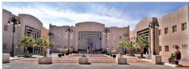
من المشاريع الجديدة التي أطلقتها جامعة حائل.

16 مدينة جامعية تضم 166 كلية و12 مستشفى تستوعب 3800 سرير