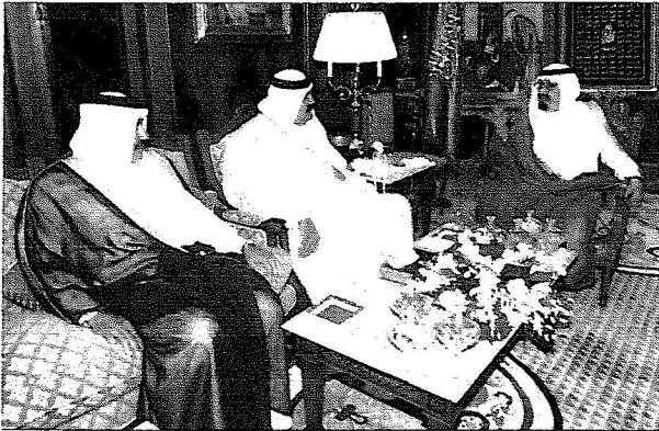
خادم الحرمين الشريفين خلال جلسة المباحثات الرسمية التي عقدها مع أمير قطر، وتناولت مجمل التطورات على الساحتين الإقليمية والدولية.

السفارة القطرية لدى المملكة، وبعد استراحة قصيرة في صالة التشريعات في المطار صحب خادم الحرمين الشريفين الملك عبد الله بن عبد العزيز الشيخ حمد بن خليفة آل ثاني في مكتب رسمي إلى قصر خادم الحرمين الشريفين، حيث أقام الملك في القصر في جدة أمس، مأمية غداء تكريماً لحمد بن خليفة آل ثاني أمير دولة قطر والوفد المرافق له. حضر المأمية الأمير مشعل بن عبد العزيز رئيس هيئة البيعة، الأمير سلمان بن عبد العزيز ولي العهد نائب رئيس مجلس الوزراء وزير الدفاع والطيران والمفتش العام، الأمير عبد العزيز نائب وزير الدفاع والطيران والمفتش العام، الأمير نايف بن عبد العزيز وزير الداخلية، الأمير عبد الله بن محمد بن عبد العزيز، الأمير فيصل بن تركي بن عبد الله، الأمير خالد الفيصل بن عبد العزيز أمير منطقة مكة المكرمة، الأمير سعود الفيصل بن عبد العزيز وزير الخارجية، الأمير مقرن بن عبد العزيز رئيس الاستخبارات العامة وعدد من الأمراء والوزراء وكبار المسؤولين من مدنيين وعسكريين.