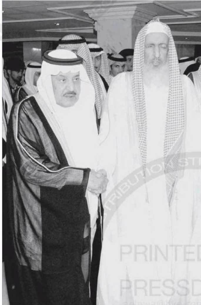
الأمير نايف مصطحباً الشيخ عبدالعزيز آل الشيخ في مناسبة سابقة.

وعلى اثره علينا ولا ننازع الأمر أهله. داعياً الله العليّ القدير لسموه العون والتوفيق عضداً أميناً لخدام الحرمين الشريفين الملك عبدالله بن عبدالعزيز يحفظه الله وناشد الحارثي على التوفيق لخدام الحرمين الشريفين ابده الله ان يشد عضده بأخيه ويحفظهم لسنوات من البذل والعطاء والإخلاص والتفاني في خدمة الدين والوطن والسعي في كافة المسارات القومية وخاصة في المجالات الأمنية والتنظيمية والاجتماعية والعلمية والخيرية التي كان لها النصيب الأكبر من اهتمامات سموه ولكنها تدور في فلك حماية الإنسان في بيته ونفسه وعرضه وماله وعبادته.