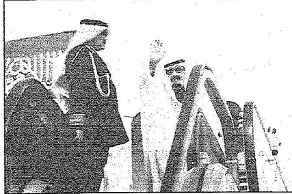
خادم الحرمين لدى مغادرته الرياض..

وكان خادم الحرمين الشريفين قد غادر بحفظ الله وسلامته الرياض بعد ظهر أمس متوجهاً إلى دولة قطر وكان في وداع الملك المفدى لدى مغادرته مطار قاعدة الرياض الجوية صاحب السمو الملكي الأمير سلطان بن عبدالعزيز آل سعود ولي العهد نائب رئيس مجلس الوزراء وزير الدفاع والطيران والمفتش العام وصاحب السمو الملكي الأمير فهد بن محمد بن عبدالعزيز وصاحب السمو