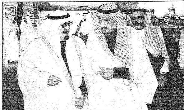
الملك لدى وصوله الرياض