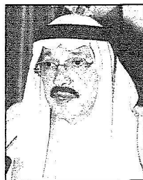
الأمير طلال بن عبدالعزيز