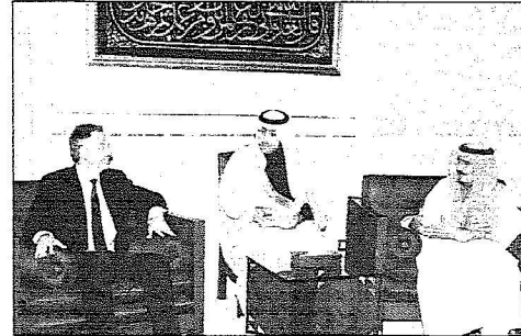
الأمير سلمان مستقبلاً تومي بليز