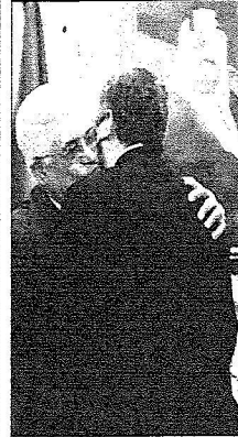
عباس يعانق مشعل بعد إعلان اتفاق مكة