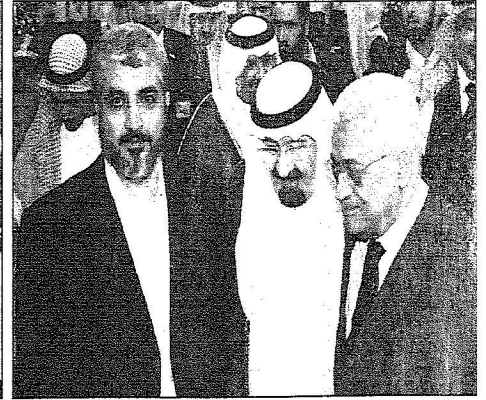
خادم الحرمين خلال استقباله الرئيس محمود عباس وخالد مشعل