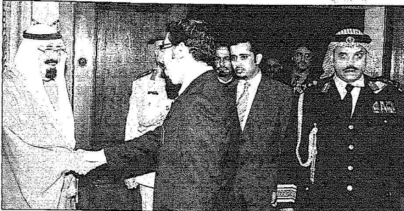
لنظرات من استقبال خادم الحرمين الشريفين لأبنائه الطلاب المبتعثين