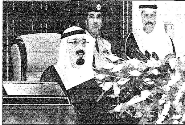
الملك في كلمته أمام الشورى أمس