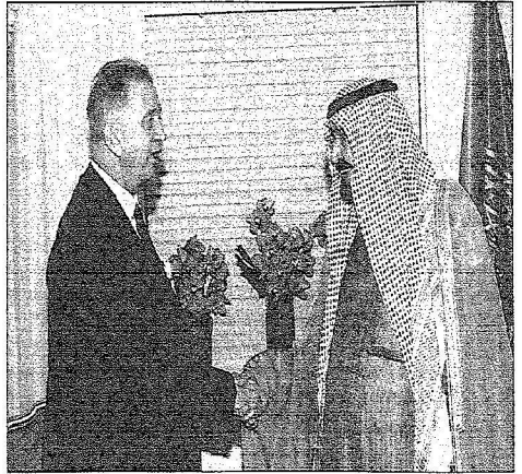
ويصفافح المبعوث الخاص للأمم المتحدة