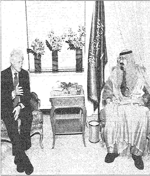
خادم الحرمين الشريفين يستقبل الرئيس الأمريكي الأسبق بيل كلينتون في مقر إقامته في نيويورك مساء أمس الأول

وايس - نيويورك تحول مقر إقامة خادم الحرمين الشريفين الملك عبد الله بن عبدالعزيز آل سعود في مدينة نيويورك إلى ما يقبضه ورشة عمل دولية تبحث في مختلف القضايا والموضوعات الهامة ليس فقط على مستوى المنطقة والأمم العربية والإسلامية، بل تتسع مظلتها لتشمل العالم أجمع ويقتد خيرها إلى شعوب الأرض كافة. فقد استعرض الملك مساء أمس الأول مع فخامة الرئيس الأمريكي السابق بيل كلينتون عددا من الموضوعات ذات الأهتمام المشترك، فيما بحث مع الأمين العام للأمم المتحدة بان كي مون سجل الأحداث الجارية على الساحة الدولية وخصوصا الأوضاع في منطقة الشرق الأوسط وعملية السلام المتعثرة في المنطقة وكذلك جهود الأمم المتحدة لإحلال السلام في عدد من المناطق التي تشهد توترات وفتراعات. وتفنن الأمين العام للأمم المتحدة عالميا مبادرة خادم الحرمين الشريفين بالدعوة للحوار بين أتباع الأديان والثقافات وما سيحققه الحوار من تفاهم وتقارب بين جميع شعوب وبنيو العالم مشيرا إلى التجاوب الذي وجدته هذه الدعوة الكريمة من قبل عدد كبير من الملوك والرؤساء وؤساء