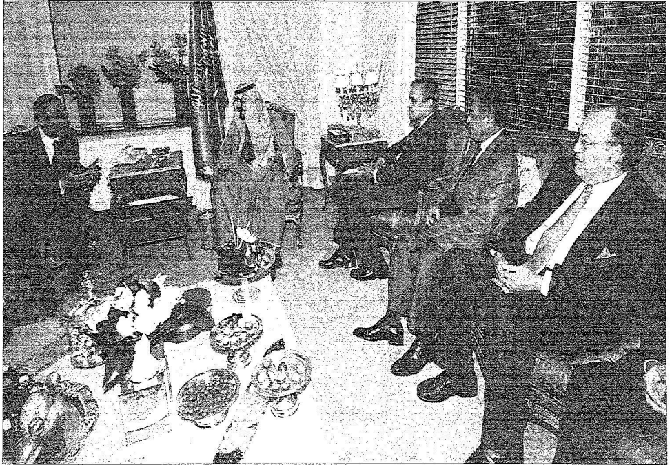
الملك خلال اجتماعه مع بلانكي مون في مقر اقامته في نيويورك أمس الأول بحضور الأميرين سعود الفيصل ومقرن بن عبدالعزيز وعدد من الوزراء.