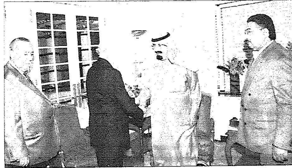
المليك خلال الاستقبال