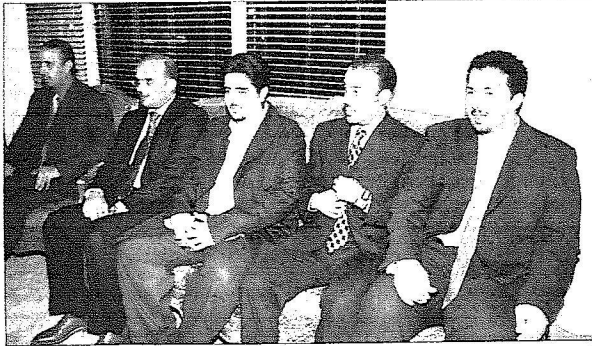
أصحاب السمو الملكي الأمراء أثناء الاستقبال