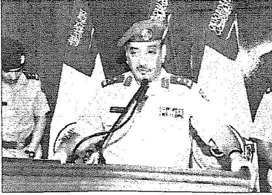
اللواء خلف المطيري

المتفوقين، موضحاً أن النسبة العامة للتحويل العلمي للدورات بلغ 92,389 ونسبة النجاح 100 بالمائة، وفيما يلي أسماء الناجح وأسماء المتفوقين: