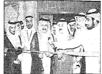
الأمير سلطان بن محمد يقص الشريطه فمفتحة المعرض للمصحب

افتتح مؤتمر طب وجراحة الصدر وكرم «الرياض» الراعي الإعلامي