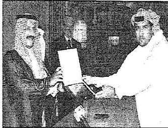
تكريم الرياضه الراعي الإعلامي