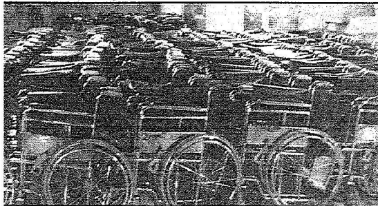
عربات متحركة للمعاقين

تحديد مواقع الإفطار داخل الحرم.. والأطعمة المسموم بها التمر، اللبن، الخبز، الأرز، اللحم. ولا يسمح بإحضار المواد السائلة