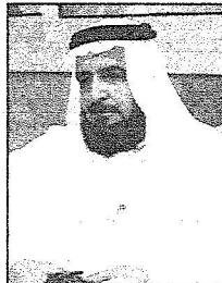
عبد الواحد خطاب

الحرمين الشريفين من خادم عبد الله حفظه الله.