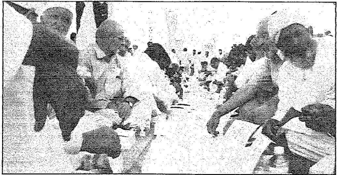
الحرم النبوي اشهر ميوائه للصائمين

يكلف أصحاب الموائد باستخدام فرش مناسب يتسع للمائدة ولن يجلس حولها والمساهمة في رفع بقايا الأطعمة والسفر عقب الإفطار مباشرة بطريقة هادئة سليمة لا يسقط معها شيء على الرخام.