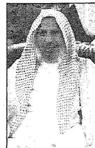
الشيخ عبدالعزيز الفالح