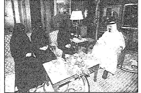
خادم الحرمين حقق الحلم الكبير بتخصيص أرض المدينة الجامعية عبر ملايين مع مسؤوليات الجامعة

نوهت بدعم القيادة للفتاة السعودية في جميع المجالات..