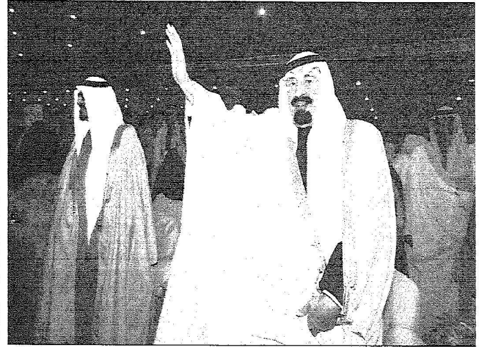
خادم الحرمين خلال رعايته لأحد المهرجانات بحضور سمو ولي العهد