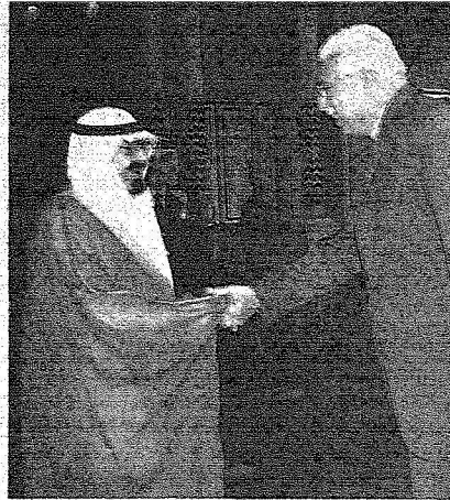
الملك خلال استقباله نظيف