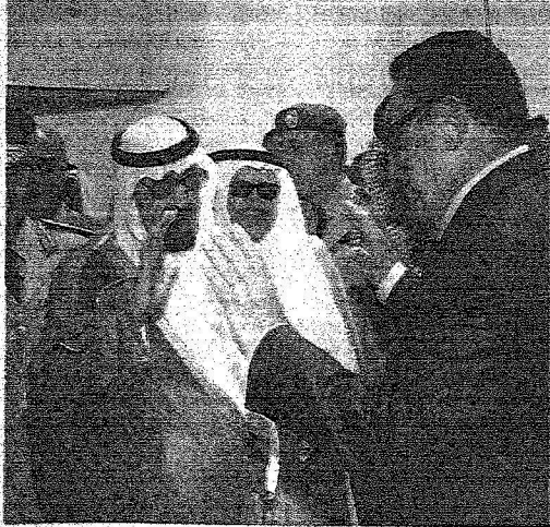
خادم الحرمين الشريفين لدى مغادرته الاسكندرية وفي يداعه الرئيس حسني مبارك