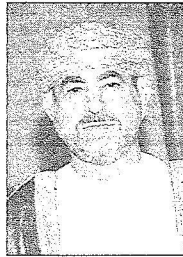
سفير سلطنة عمان