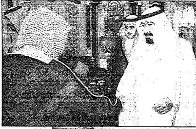
ويلتقي أعضاء اللجنة الرئاسية لمركز الحوار الوطني.

السمو الملكي الأمير فهد بن سلطان بن عبدالعزيز أمير منطقة تبوك وصاحب السمو الملكي الأمير فيصل بن خالد بن عبدالعزیز أمير منطقة عسير وصاحب السمو الملكي الأمير فهد بن بدر بن عبدالعزيز أمير منطقة الجوف وصاحب السمو الملكي الأمير عبدالعزيز بن ماجد بن عبدالعزيز أمير منطقة المدينة للتورة بمناسبة انعقاد اجتماعهم السنوي الخامس عشر بكرة المكرمة، واستقبل خادم الحرمين الشريفين -أيده الله- معالي الرئيس العام لشؤون المسجد الحرام والمسجد النبوي الشريف رئيس اللجنة الرئاسية لوكالات التطوير الوطني الشيخ صالح بن عبدالرحمن الحصين ومعه اللجنة معالي الدكتور محمد الطهيج عمر نصيف ومعالي الدكتور راشد الراجح الشريف ومعالي وزير التربية والتعليم الدكتور عبدالله بن صالح العبيد ومعالي المستشار بالديوان الملكي الأمير مركز الملك عبدالعزيز للحوار الوطني الأستاذ فيصل بن عبدالرحمن بن معمر. وقد أقام خادم الحرمين الشريفين مائدة إفطار تكريماً لخصامة الرئيس علي عبدالله صالح والوفد المرافق له. حضر الاستقبالات ومائدة الإفطار صاحب السمو الملكي الأمير عبدالعزيز بن عبدالعزیز وصاحب السمو الملكي الأمير أحمد بن عبدالعزيز نايب وزير الداخلية وصاحب السمو الملكي الأمير مقرن بن عبدالعزیز رئيس الاستخبارات العامة وصاحب السمو الملكي الأمير عبدالرحمن بن ناصر بن عبدالعزیز محافظ الخرج وصاحب السمو الأمير فيصل بن عبدالله بن محمد آل سعود مساعد رئيس الاستخبارات العامة وصاحب السمو الأمير