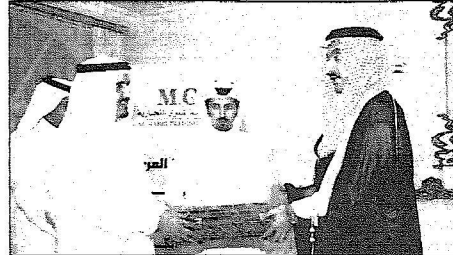
هدية تذكارية للأمير عبدالعزيز بن جلوي

عبد اللطيف المحسن - المهوف بحضور صاحب السمو الأمير عبدالعزيز بن محمد بن جلوي آل سعود المشرف العام على مسابقة الأمير محمد بن فهد بن جلوي للقرآن والنسنة والخطابة أقيم يوم أمس الحفل السنوي الخيري الأول والذي تنظمه الجمعية الخيرية بالبرز بالتعاون مع مجموعة شركات المري التجارية بقصر رجل الأعمال سالم بن صبيح المري . وقد أكد صاحب