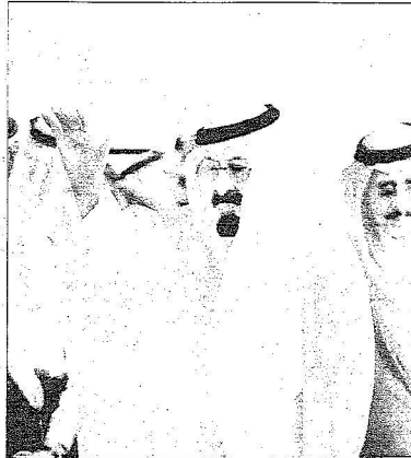
خدام الحرمين يحيي مستقبليه لدى وصوله إلى مقر حفل تشييد المشروعات