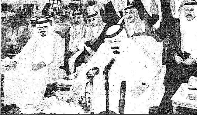
مخاطب الحرمين الشريفين بنديش عددا من المشروعات بجوارف أمس بحضور ولي العهد

عبدالله بن عبدالعزيز السكينة. إثر ذلك، ألقى وزير التعليم مجلس إدارة المؤسسة العامة للتعليم الفتي والتدريب المهني الدكتور غازي بن عبدالحمن القصيبي كلمة قال فيها: إن هم البطالة يؤرق أكثر من أي مواطن، وإنك تحمله في نفسك ماجسا وفي عيونك سهرأ وفي قلبك الكبير تخافو لأ وأسلأ والقضاء على البطالة مهمة صعبة ولكنها لا تستعصي على الإيمان والصبر والدأب، وجرة قوية من الوطنية الصادقة، يتتافي مع الوطنية أن يعمل بعضنا ويقي البعض الآخر يتسكعون على أرفصة الإحباط والفقر ويتتافي مع الوطنية أن يفضل رجال الأعمال الوافدين على أبنائنا وبناتنا مهما كانت التبريرات بمنطق البهالة والريال، ويتتافي مع الوطنية أن يتوقع شاب لم