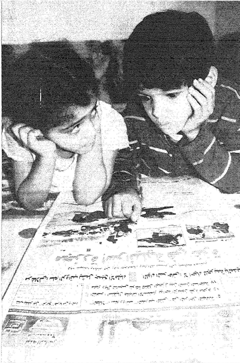
طفلان يتابعان احداث غزة في جريدة المدينة