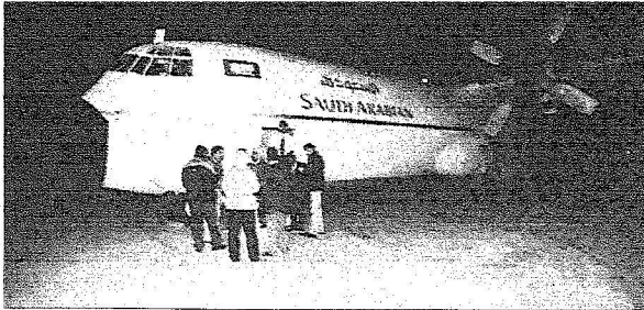
طائرة الاخلاء الطبي بمطار العريش