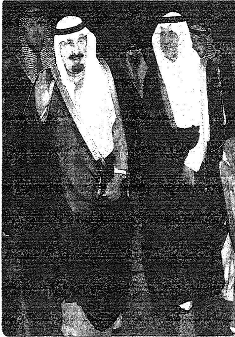
...وشا لحظة وصوله مقر الحفل.