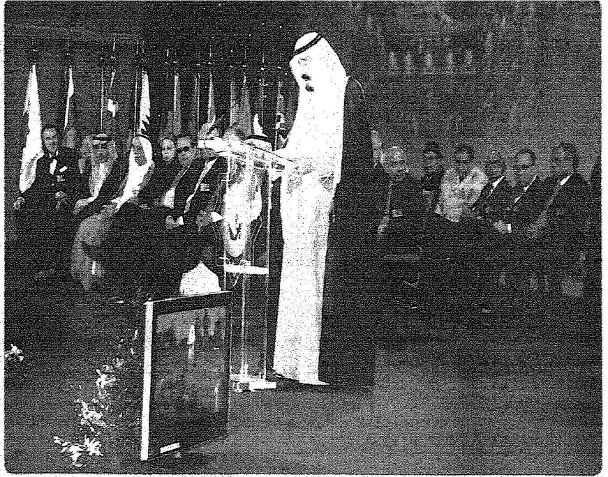
خادم الحرمين الشريفين خلال وعائه حفل الجائزة