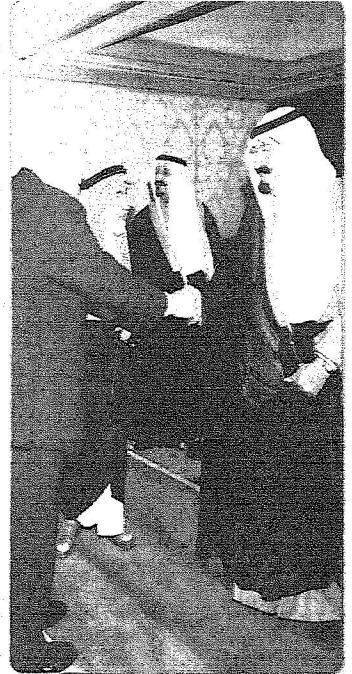
الملك يصافح عدد من الممثلين بالجزيرة التجارية الأولى