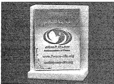
شعائر سفراء السلام