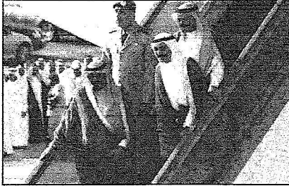
خادم الحرمين لحظة وصوله إلى مطار جازان

وقد وصل في معية خادم الحرمين الشريفين - حفظه الله - صاحب السمو الملكي الأمير عبدالرحمن بن عبدالعزيز ونائب وزير الدفاع والطيران والمفتش العام وصاحب السمو الملكي الأمير متعب بن عبدالعزيز وزير الشؤون البلدية والقروية وصاحب السمو الأمير بندر بن محمد بن