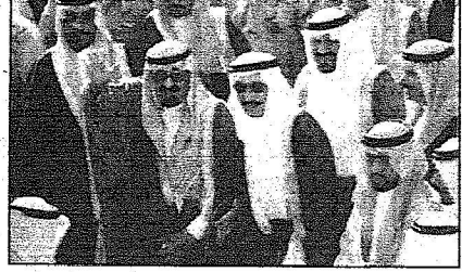
خادم الحرمين بحيي مستقبله لدى وصوله إلى جازان

السمو الملكي الأمير خالد الفيصل بن عبدالعزيز أمير منطقة عسير وصاحب سمو الملكي الأمير فيصل بن خالد بن عبدالعزيز نائب أمير منطقة عسير وصاحب سمو الملكي الأمير بندر بن خالد الفيصل بن عبدالعزيز وصاحب سمو الملكي الأمير سلطان بن خالد الفيصل بن عبدالعزيز وصاحب سمو الملكي الأمير سعود بن خالد الفيصل بن عبدالعزيز ووكيل إمارة منطقة عسير الدكتور عبدالعزيز بن عبدالله الخضير وكبار المسؤولين من مدنيين وعسكريين وجمع غفير من المواطنين.