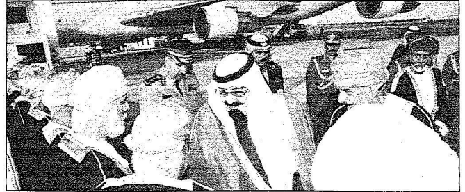
خادم الحرمين الشريفين يصادف مستقبله لدى وصوله إلى مسقط

السلطان قابوس تقدم مستقبليه بمطار السيب الدولي