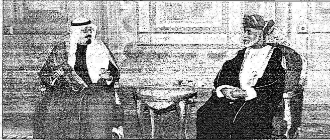
حديث أخوي بين الملك والسلطان قابوس