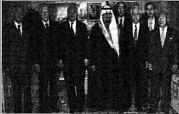
ويستقبل جمعيتي الصداقة ومسلمي اليابان