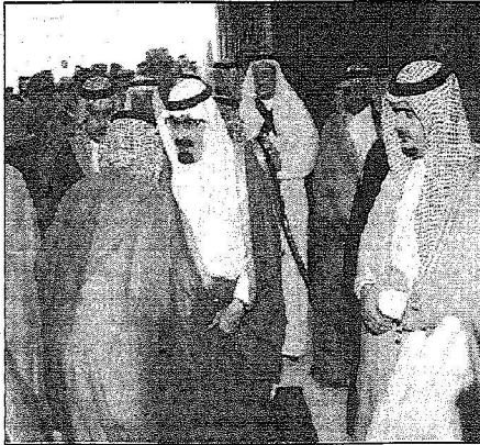
ويستقبل الأمراء والمواطنين وقادة وضباط الحرس الوطني