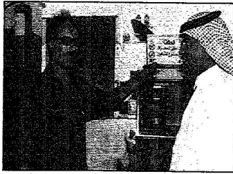
رمضان المكرمة ليست بقرينة

المصدر : الرياض التاريخ : 02-05-2006 العدد : 13826 الصفحات : 6 المسلسل : 50