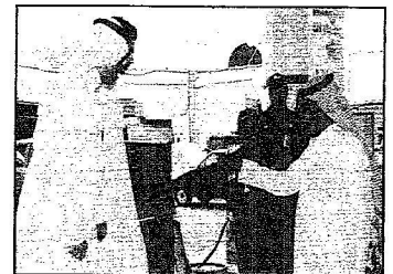
الزميل الزومان مع مسؤولي الشركة في تعديل السعر