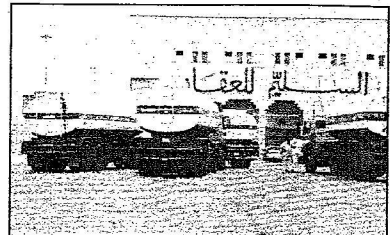
صالح بن عبدالعزيز تنظر تفريع حولتنا

وقد قامت بالرياض بجولة على عدد من محطات البنزين في مواقع مختلفة من مدينة الرياض حيث عهد القرار تفتوتاً في