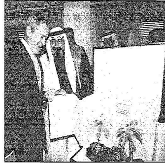
الملك عبدالله يقدم هدية تذكارية للرئيس بوش