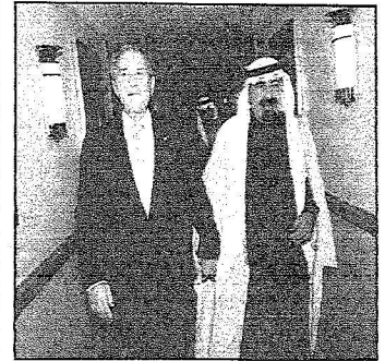
خادم الحرمين والرئيس الأمريكي خلال الاستقبال بواشنطن