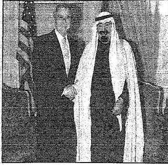
الملك عبدالله والرئيس بوش خلال الاستقبال بواشنطن