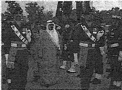
خادم الحرمين الشريفين يستعرض حرس الشرف

والتعليمية، فهذه المجالات تحتاج منا العمل لتوثيقها باعتبار أن البلدين لديهما إمكانات وقدرات يمكن توظيفها لصالح تعزيز هذا التعاون. وأكد السيد اختر أن المرحلة القادمة ستشهد مزيداً من التعاون في مجال الاستثمارات وتبادل الوفود التجارية والتعليمية بهدف استكشاف مجالات التعاون. من ناحية قال وزير الصناعة جهانگیر تريم إن التعاون في المجالات الصناعية يعتبر جيداً، ولكنه يحتاج إلى مزيد من التكثيف بهدف توسيع دائرة التعاون في مجال الصناعات بالبلدين باعتبار أن هناك فرصاً وأبعاداً لإيجاد مشاريع مشتركة بين القطاعين