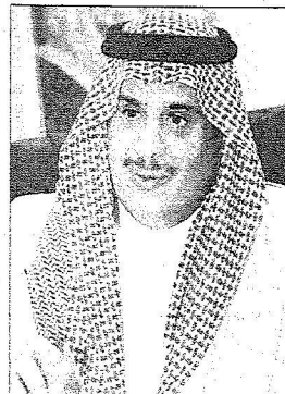
سلطان بن فهد

اجرى صاحب السمو الملكي الامير سلطان بن ابراهيم بن عبدالعزيز الرئيس العام لرعاية الشباب رئيس الاتحاد السعودي لكرة القدم امس الاول بمدير منتخب المملكة الاول لكرة القدم فهد محمد المصبيح اطمأن فيه سموه على سير برنامج اعداد المنتخب المقام حالياً بالمنطقة الشرقية استعداداً للمشاركة في دورة كأس الخليج العربي الـ 19 لكرة القدم المقرر اقامتها بسلطنة عمان خلال شهر يناير القادم. وطلب سمو الامير سلطان بن فهد بن عبدالعزيز من مدير المنتخب نقل تحياته لجميع أعضاء البعثة وتقديره للجهود التي يبذلها الجميع من اجهزة ادارية وفنية وطبية ولاعبين خلال المرحلة الحالية من اعداد المنتخب للمشاركة في الدورة التي تسعى من خلالها لتقديم المستوى المشرف لكرة السعودية وما تحقق لها من انجازات ومكتسبات قارية ودولية وذلك بفضل من الله سبحانه وتعالى ثم بتواصل الدعم السخي الذي يجده القطاعين الشبلي والرياضي من