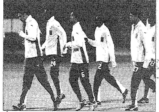
جانب من تدريبات منتخبنا في معسكر الشارقة