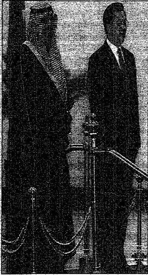
خادم الحرمين الشريفين والبرئيس الصيني خلال استعراض حرس الشرف بقاعة الشعب الكبرى ببيكين.

الجانب السعودي والصيني بحثا آفاق التعاون بين البلدين ومجمل الأحداث والتطورات على الساحتين الإقليمية والدولية