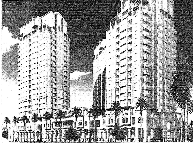
المشروعات المعلقة تمام وفق استراتيجيات ضمانة

بطاقة التميز ويكون معبراً إلى ابتكار رائع وعنوان فريد للخبذة وتعكسا إيجابيا على منطقة المشروع وعلى مدينة جدة. × لماذا اختير هذا المسمى للمشروع؟ تم اختيار الاسم لعاملين أساسيين اولهما ان المشروع يحتضن بين جنباتها أكبر