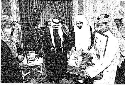
خادم الحرمين لدى استقباله الطماء والفائزين بمسابقة الحرس الوطني لحفظ القرآن

الشريفيين حفظه الله بالقرآن الكريم وأمله تأكيداً لهذه السياسة الحكيمة والمنهج الرشيد الذي سارت عليه المملكة منذ تأسيسها على يد المؤسس الملك عبدالعزيز بن عبد الرحمن آل سعود رحمه الله.