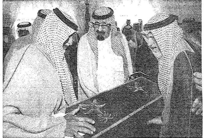
خادم الحرمين الشريفين يتسلم هدية من أهالي منطقة نجران