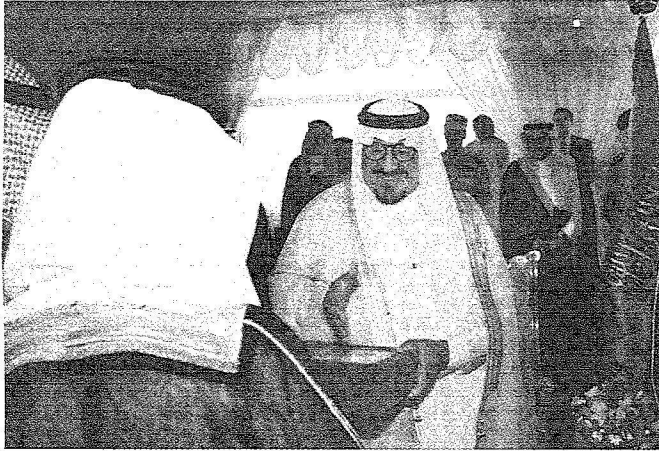
ولي العهد يتسلم هدية من أهالي منطقة نجران