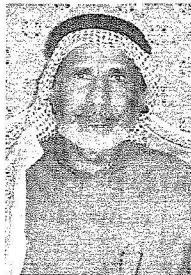
الشيخ ناصر بن فريج الدوسري