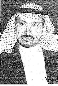
الشيخ فهد بن عبدالعزيز

الغفير من الناس يقرأ على محياهم السعادة حيث استفاد من هذا الحفل الفقير والغني ورجع ابن جريس أنه ربما يتراوح مبيعات من تواجد خلال الحفل والعرض يقدر بمليار ريال حيث اشترى عدد من الناس أعدادا كثيرة من الإبل تتراوح أسعارها بحدود ٦٠٠ ألف ريال، كذلك دارت عجلة الاستئمان في عدة أشياء أبرزها الإبل والأغنام والحطب والمواد الغذائية مما جعل الفقير والغني يستفيد وهذا بفضل حكومتنا الرشيدة ودعم تشجيع صاحب السمو الملكي الأمير مشعل بن عبدالعزيز الذي بذل جهوداً كبيرة في تنظيم هذا المهرجان الذي ينشده الجميع ويتمناه الكل للاستمتاع بالتراث الوطني من جهته عرض فهد بن سلطان العتيبي مقترحاً على اللجنة منح أصحاب المراكز الأولى من المشاركة في المرات في حالة الفوز إلا بعد ثلاث سنوات بهدف الإنتاج مشيراً إلى أنه طوال السنوات الماضية