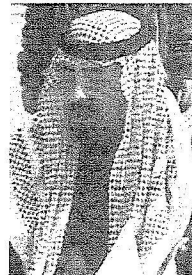
الامير عبدالله بن سعد بن جاري