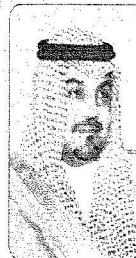
الأمير عبد العزيز بن ماجد

أكد نائب الرئيس العام لشؤون المسجد النبوي معالي الشيخ عبدالعزيز بن عبدالله الفالح استعداد وكالة الرئاسة العامة لشؤون المسجد النبوي لتقديم أفضل الرعاية وأفضل الخدمات لضيوف بيت الله الحرام وزوار مسجد رسوله حتى يؤدوا مناسكهم وعباداتهم في راحة واطمئنان وذلك من خلال تهيئة المرافق والتأكد من جاهزيتها والارتقاء بمستوى الخدمات المقدمة لزوار المسجد النبوي والإسهام في تفقيهم وتوعيتهم بأسور دينهم، مشيراً إلى أن وكالة الرئاسة بالمدينة يدارتها المختصة تسخر كل إمكانياتها وطاقاتها لتلبية الاحتياجات المطلوبة والمنهية لراحة زوار مسجد الرسول في كل وقت وفي شهر رمضان