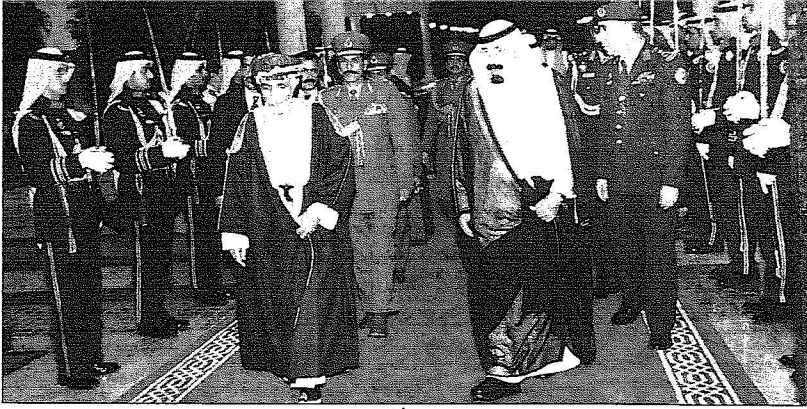
الملك عبدالله يقيم حفل عشاء تكريماً لأخيه السلطان قابوس.. (واس)