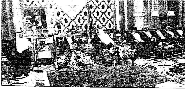
لملك عبدالله لدى تكريمه للمسلمان قابوس بحضور سمو ولي العهد...